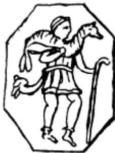
Гемма с изображением Доброго Пастыря, несущего на плечах потерявшуюся овцу (иллюстрация из книги: King C.W. The Gnostics and Their Remains, Ancient and Mediaeval. London, 1864. P. 200 )

Что бы сказал благочестивый Елифаный, если бы он ныне ожил и зашел бы в собор Святого Петра в Риме! Кажется, Амброджо 185 также приходит в отчаяние при мысли, что некоторые люди полностью поверили сообщению Лампридия 186 , что Александр Север имел в своей частной часовне изображение Христа среди других великих философов 187 . «Что язычники могли сохранить облик Христа, – восклицает он, – но его ученики этого не сделали – это вещь, которую ум отказывается принять и еще менее – поверить» 188 .