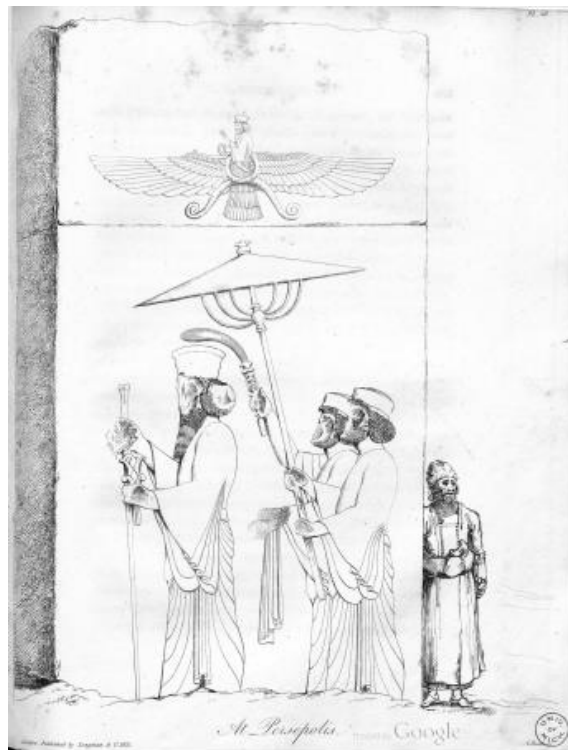
«...Ферузэр или духовный прообраз царя, который, согласно Зенд-Авесте, всегда парит рядом с ним...» (Porter R.K. Travels in Georgia, Persia, Armenia, Ancient Babylonia, &c. &c. During the years 1817, 1818, 1819, and 1820. Vol. I. London, 1821. P. 656–657)

Вместо того чтобы утешать, три друга страдающего Иова стараются убедить его, что его несчастье нашло на него в наказание за какие-то великие прегрешения с его стороны. Швырнув обратно их обвинения, Иов клянется, что до тех пор, пока он дышит, он будет защищать свое дело. Он оглядывается на период своего преуспевания, «когда милость Божия была над шатром его» 132 , и он был судьей, «сидевшим во главе и жившим как царь в кругу воинов, как утешитель плачущих» 133 , и сравнивает с этим нынешнее время – когда кочующие бедуины, люди – «отребье земли» 134 , насмеялись над ним, когда он был повержен несчастьем и отвратительной болезнью. Затем он заявляет о своем сострадании к несчастным, своей чистоте, честности, неподкупности, своем строгом правосудии, своей благотворительности, скромности, непричастности к распространенному поклонению солнцу, своей кротости по отношению к врагам, гостеприимстве к странникам, своем открытом сердце, своей смелой защите правого, хотя он наталкивался на толпы и осуждение семейств; и он взывает к Всемогущему, чтобы тот ответил ему, и требует от противников, чтобы те написали, в чем он виноват.