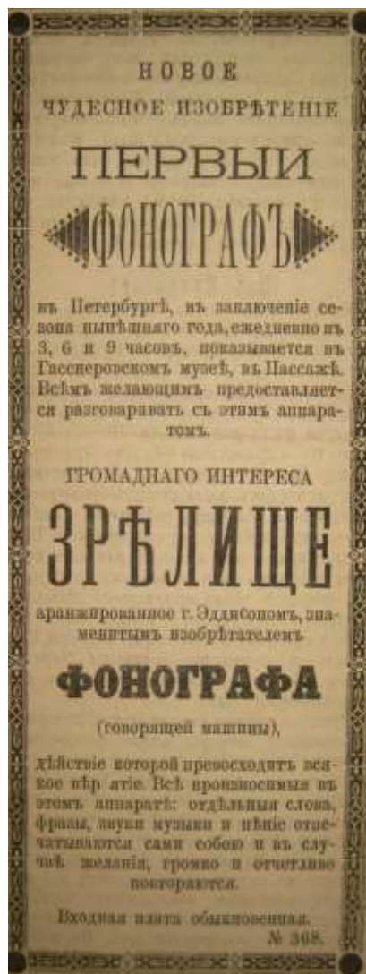
Объявление из газеты «Русский мир» (1878, №120, 5 мая)

Кришнаварма научил его еще двум штукам, так что с машинкой почти незаметной на шее глухие будут совершенно хорошо слышать» 17 .