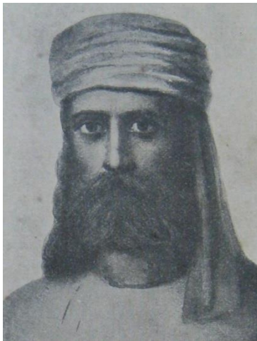
Фотография Учителя 45

Лалл-Синга, «громادного роста раджпута, независимого такура из провинции Раджистан», о котором «ходила молва, будто он принадлежит к секте радж-йогов , посвященных в таинство магии, алхимии и разных других сокровенных наук Индии» 43 . Е.И.Рерих писала о «великом подвиге» Е.П.Блаватской, которая помимо того, что «явила миру прекраснейшее Сокровенное Учение, дала впервые религиозно-философский синтез всех веков и народов, создала международный Братский Союз», также «дала величайшее счастье знания о существовании Великих Хранителей и Водителей нашего человечества и пути к Ним» 44 .